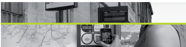
Une borne d'information sur 200 arrêts de bus

Une marguerite Temps Réel sur chaque arrêt de bus : votre smartphone affiche les prochains passages des lignes desservant votre arrêt grâce à un tag NFC et un Flash Code